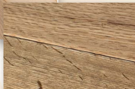
Eiche Stony Hill antik, geräuchert, natur geölt