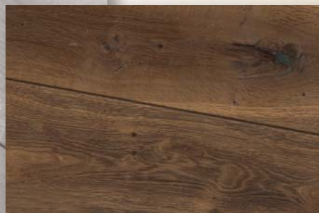
Eiche Verona geräuchert, natur geölt