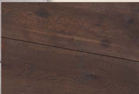
Eiche Arezzo geräuchert, schwarz geölt