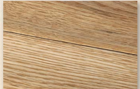
Eiche Safari handgehobelt, natur geölt

Produced under license of Unilin - EP nr. 0843763/US, patent nr. 6.006.486