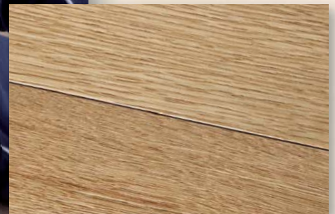
Eiche Country gebürstet, natur geölt