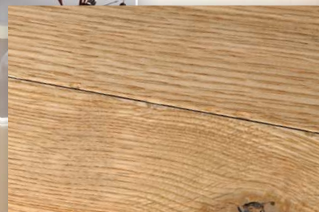
Eiche Toscana antik, natur geölt