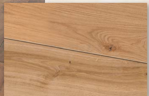
Eiche Veneto natur geölt