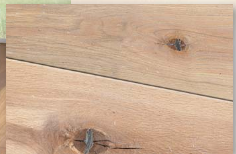
Eiche Prato weiß geölt