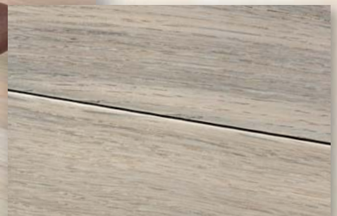
Eiche Nebraska handgehobelt, geräuchert, weiß geölt