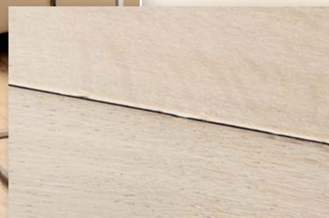
Eiche Western antik, weiß geölt