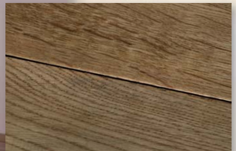
Eiche Colorado handgehobelt, geräuchert, natur geölt