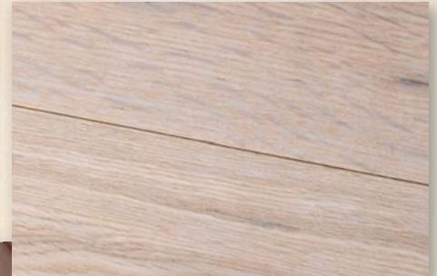
Eiche Country gebürstet, weiß geölt

Die Casella SL – Typen Matera und Emilia zeichnen sich durch eine eindrucksvolle Dielengröße aus. Mit ihrem Dielenmaß von 2200 x 260 mm verleihen sie jedem Raum eine besonders klare und großzügige Ausstrahlung. Ausgestattet mit der längsseitig gefasteten Kante sowie einer gebürsteten und geölten Oberfläche wird dieser Boden zu einem wahren Schmuckstück seiner Art. Beide Typen sind mit einer herkömmlichen Nut- und Federverbindung ausgestattet.