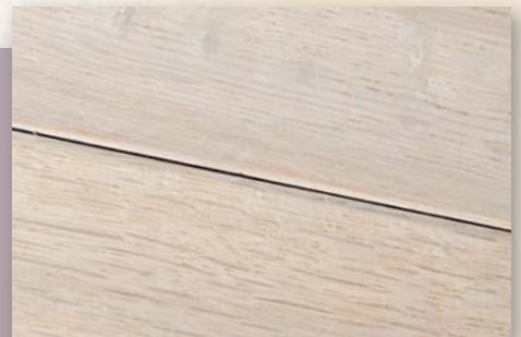
Eiche Arktis handgehobelt, weiß geölt