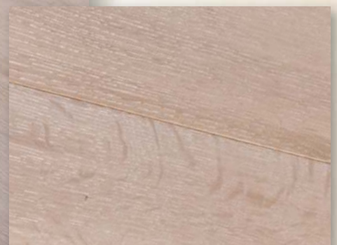
Eiche Matera (Dielengröße: 2200 x 260 x 15 mm) gebürstet, weiß geölt,