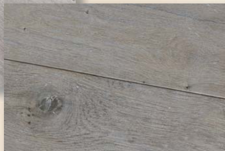
Eiche Monza geräuchert, weiß geölt