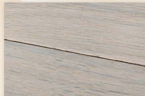
Eiche Taiga antik, geräuchert, weiß geölt