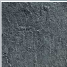
Dekor Schiefer anthrazit