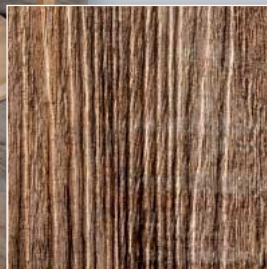
Dekor Eiche burgund